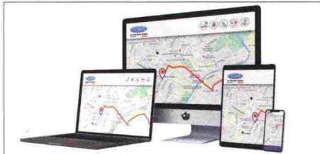
Viasat Fleet offre avanzati sistemi telematici.

azioni correttive da attivare per ridurle; verifica del corretto adempimento degli oneri (formazione, informazione, controllo). In caso di controversie, il team di consulenti attiva l'assistenza di secondo livello (tachoLex), affidando ai nostri legali le pratiche di ricorso, su tutto il territorio nazionale, per le violazioni al Codice della Strada e ai regolamenti europei sul cronotachigrafo, infortunistica stradale, difesa